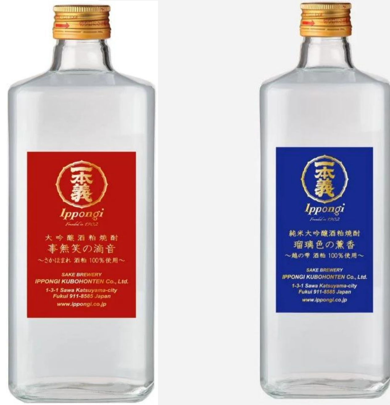
一本義久保本店「事無笑の滴音」40度「瑠璃色の薫香」40度