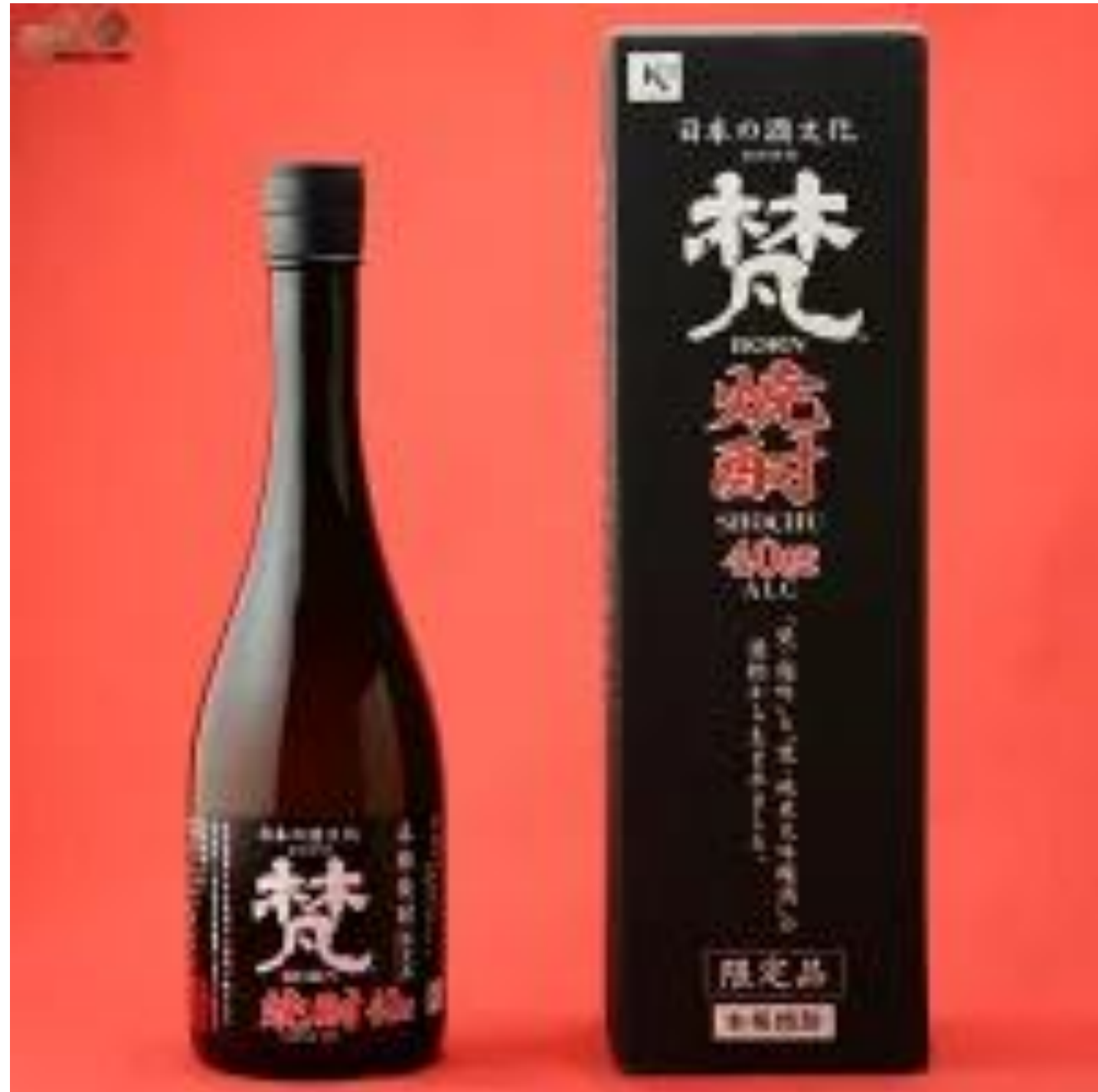
加藤吉平商店「焚」40度

百人町「さなぶり」では、全国47都道府県の郷土料理と粕取焼酎を愉しむ会を毎月第一土曜日に開催しています。第十六回目は第一土曜日で、福井県の粕取焼酎と福井県の食を愉しむ会です。皆様お誘いあわせの上、奮ってご参加ください。